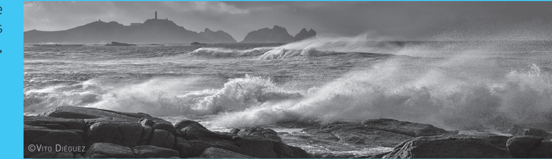
TEMPORAL NA COSTA DA MORTE

A Costa da Morte forma parte da foxa blastomilonítica, un complexo de rochas (granitos, gneís e xistos) da erá precámbrica, de hai 500 millóns de anos, un dos relevos máis antigos do mundo. Presenta formas moi variadas, nas que os treitos abruptos con cantís de fortes pendentes (Touriñán, Vilán) se alternan con outros baixos e areentos (Laxe, O Lago, Mar de Fóra), lagoas litorais (Traba) ou rías (Corme-Laxe, Camariñas ou Lires onde desembocan o río Antóns, o Grande e o do Castro respectivamente).