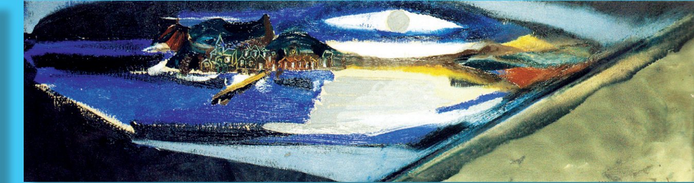
AROU, COSTA DA MORTE DE BERGANTIÑOS

Acrílico sobre lenzo (46x65) Alfonso Abelenda [A Coruña 1931]