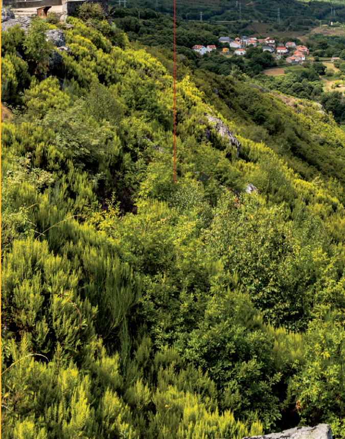
MOSTEIRO DE STO. ESTEVO DE RIBAS DE SIL

Nos lugares onde hai un certo desenvolvemento dos solos medran as matogueiras formadas por uces e xestas.