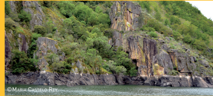
PAREDE DE ROCHA NO CANÓN DO SIL

Nas zonas menos afectadas polos lumes, medra a vexetación mediterránea lacineiras e sobreiras. Está adaptada a solos pouco profundos e á seca do verán.