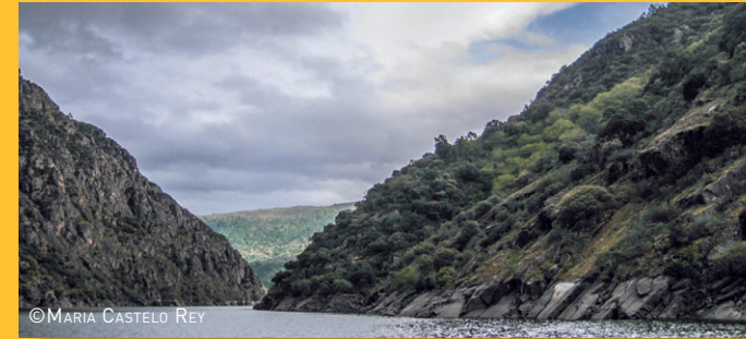
CANÓN DO SIL

O Cotarro das Boedas elévase por riba dos 700 metros de altura sobre o nivel do mar, desprovisto de vexetación ante a ausencia de soto.