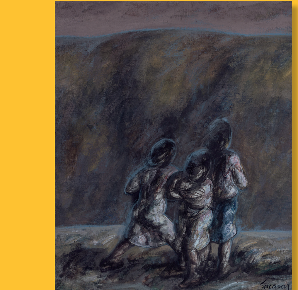
XENTE DE SOUTOLONGO. Óleo sobre lenzo (73x60) Alfonso Sucasas Guerra (Latín 1940 - Vila de Cruces 2012)

As Chousas de Vilar de Cereda Fontes As Canellas A Rasa Pé de Home Cimadevila A Ribeira Parada Seca