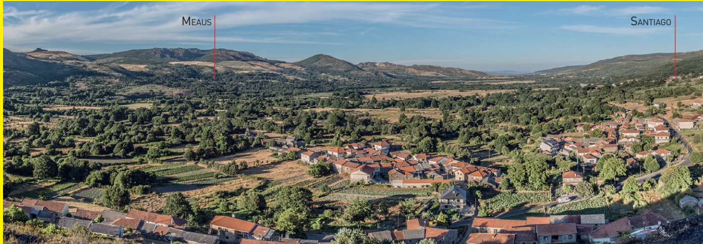
AS TRES ALDEAS DO COUTO MIXTO: NO PRIMEIRO PLANO RUBIAS, MEAUS E SANTIAGO AO FONDO

O Couto Mixto era un territorio fronteirizo entre Galicia e Portugal con goberno e xustiza propios. Non pagaban impostos en ningún dos dous países. En 1864, un acordo entre España e Portugal suprimiu e pasou a formar parte dos concellos de Calvos de Randín e Baltar na provincia de Ourense. Nos últimos anos estase a loitar pola recuperación da súa memoria histórica.