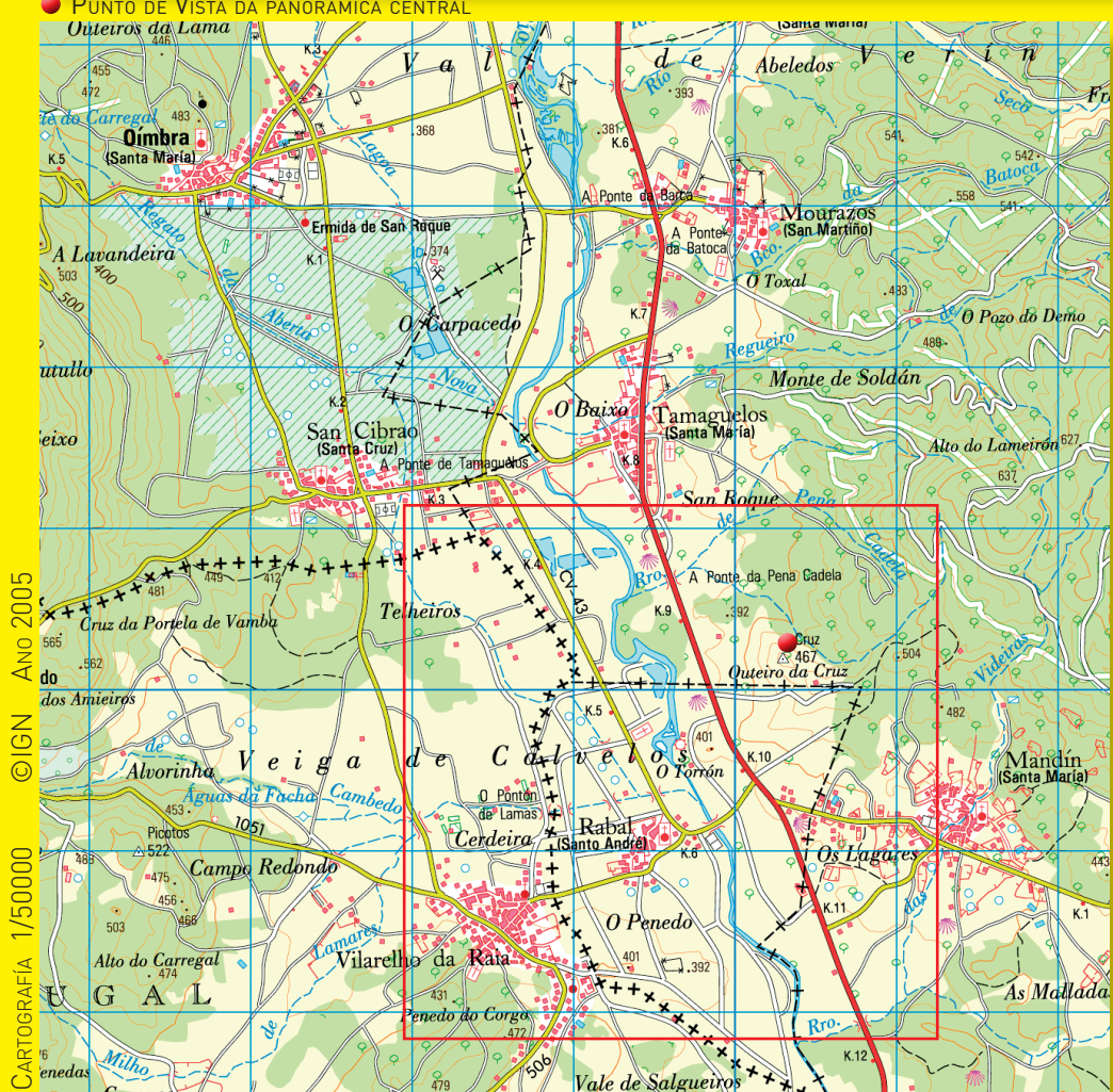
© IGN - Ano 2005 do IGN do Anos Antigos 1/50000 CARTOGRAFIA