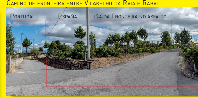
CAMIÑO DE FRONTEIRA ENTRE VILARELHO DA RAIA E RABAL

Os habitantes compartiron desde sempre o seu xeito de vivir, a súa cultura e a súa lingua. As mulleres de Vilarelho da Raia lavaban no río en Rabal e os nenos e nenas de Rabal tiñan o seu lugar de lecer diario en Vilarelho.