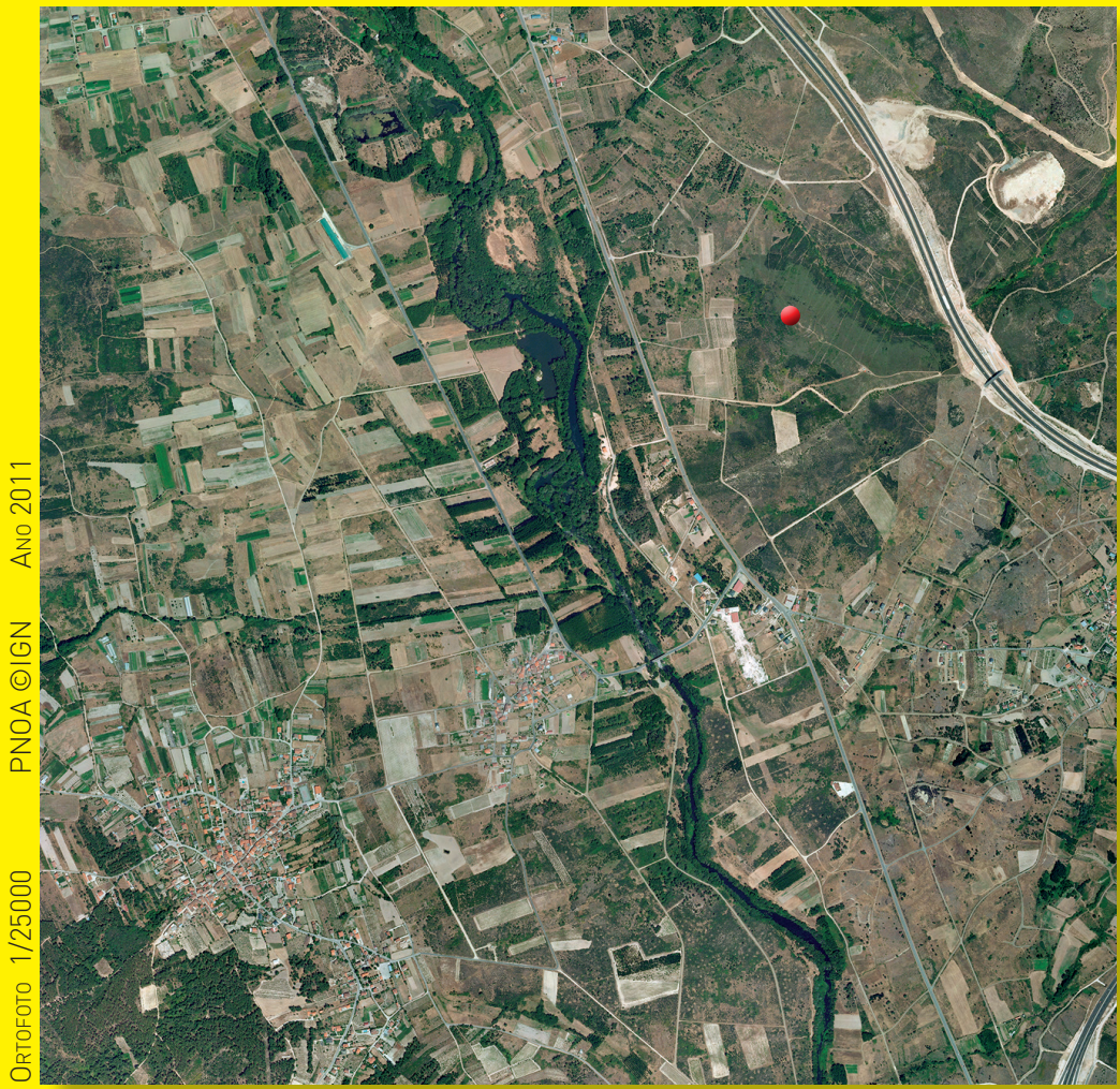
© IGN - Ano 2011 PNOA © IGN Densidade: 1/25000