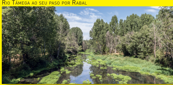
RIO TÂMEGA AO SEU PASO POR RABAL

Nas terras raianas, a poboación dedicouse tradicionalmente a actividades agropecuarias e ao contrabando de produtos alimentarios e manufacturados. Desde a desaparición das fronteiras coa integración europea, o contrabando esmoreceu.