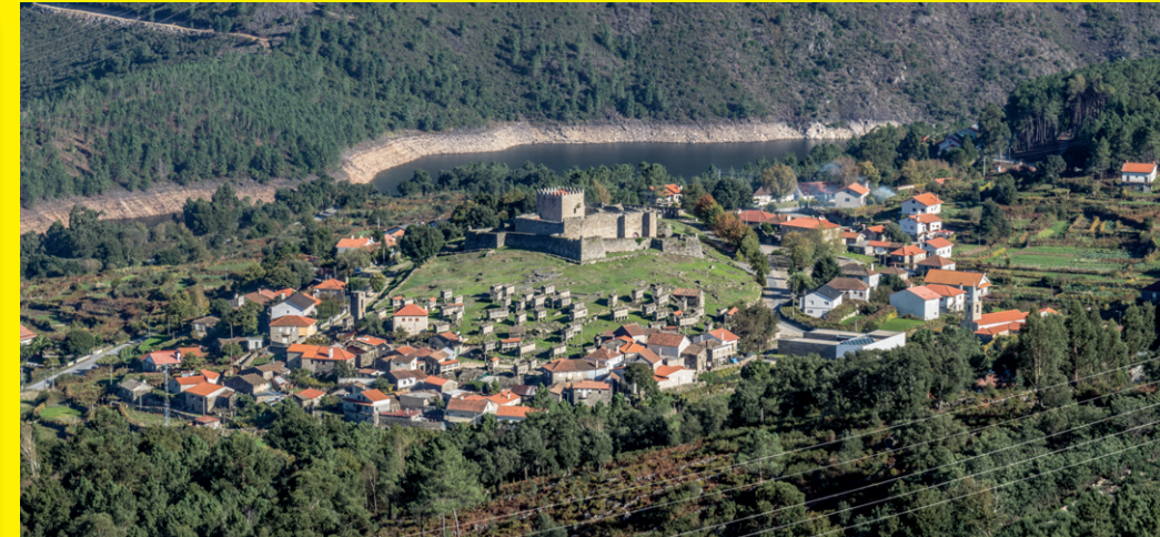
CASTELO E CAMPO DE ESPIQUEIROS (HORREOS) EN LINDOSO

O castelo portugués de Lindoso é un exemplo de fortaleza fronteiriza. Na actualidade atrae a moitos visitantes. Ao seu pé, atópase un dos centros de información do Parque Nacional da Peneda-Gerês, rodeado dun excepcional campo de hórreos.