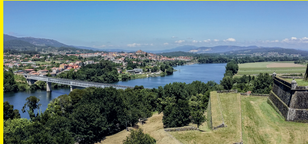
VISTA DE TUI DESDE A FORTALEZA DE VALENÇA DO MINHO

O treito final do río Miño foi usado para establecer a fronteira entre Galicia e Portugal. Durante séculos, Tui (Galicia) e Valença do Minho (Portugal) opuxéronse a unha á outra con imponentes fortalezas defensivas. Esta situación repítese en Arbo-Melgaço, Salvaterra-Monção, A Guarda-Caminha, etc.