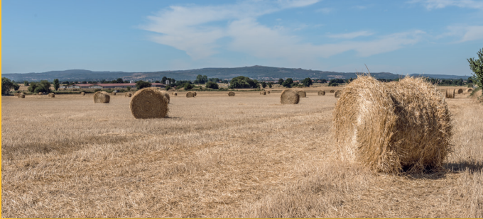
RULOS DE PALLA. LEIRA DESPOIS DA SEGA

Nas veigas do sur da Lagoa de Antela hai zonas sen concentración parcelaria nas que aínda se pode ver a paisaxe tradicional. As leiras están pechadas por sebes de árbores e matogueiras, que diminúen a velocidade do vento e a evaporación, favorecen a infiltración das augas e acollen insectos, paxaros e pequenos mamíferos que axudan a controlar as pragas que afectan os cultivos. Este tipo de paisaxe é coñecido na Limia como “touzas”.