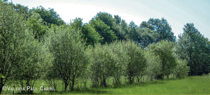
SEBES DE ÁRBORES E MATOGUEIRAS

Os asentamentos de poboación ubicábanse nas marxes da antiga Lagoa de Antela para evitar a auga. A vila reitora é Xinzo de Limia. Hoxe algunhas das novas edificacións sitúanse en terreos da antiga lagoa.