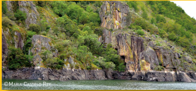
PAREDE DE ROCHA NO CANÓN DO SIL