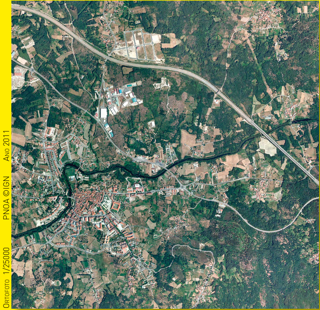
Dezembro, 1/25000 PNOA ©IGN Ano 2011