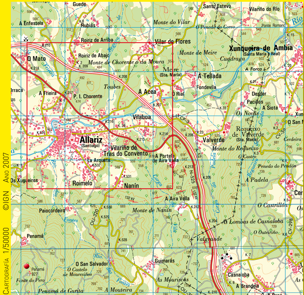
CARTOGRAFÍA 1/50000 ©IGN - Ano 2007