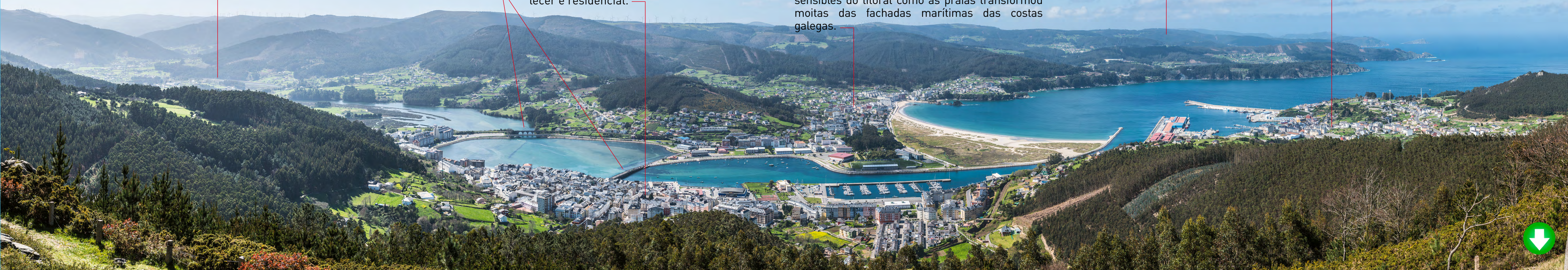
EUCALÍPTAL DE CHAVÍN NO SOUTO DA RETORTA