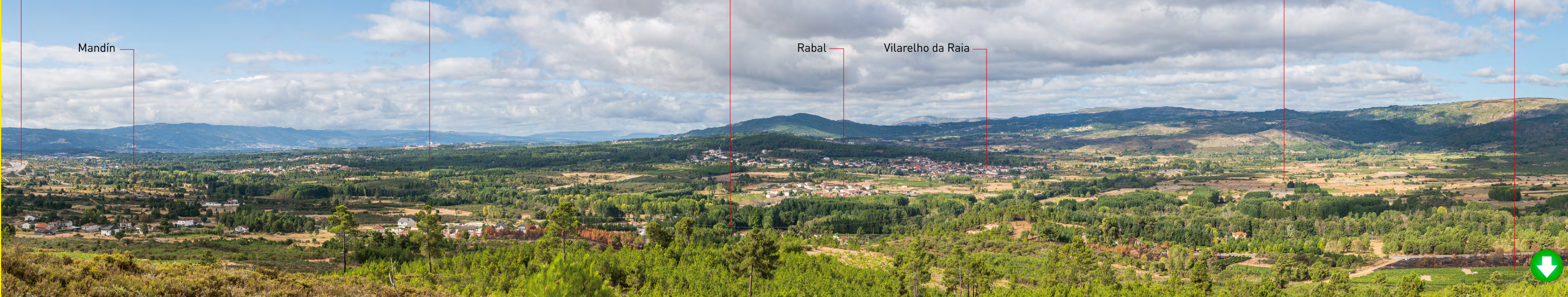
POBO PROMISCUO DE LAMA DE ARÇOS

Os viñedos desta zona de Galicia pertencen á denominación de orixe de Monterrei. A moi boa acollida dos seus viños está a provocar o incremento da superficie vitícola.